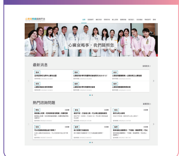
圖、心衰竭照護諮詢平台首頁

李啟明醫師指出，為了提供更有效、持續的照顧，臺大心衰竭團隊成立了「心衰竭照護諮詢平台」網站，網站功能十分齊全，除了服藥、飲食與體重管理等衛教資訊之外，也教導病患如何追蹤個人健康資訊。